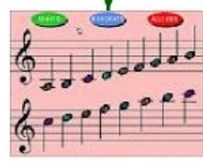
SUONI E SILLABE