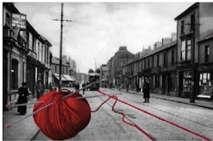
IL MESSAGGIO DEL POETA